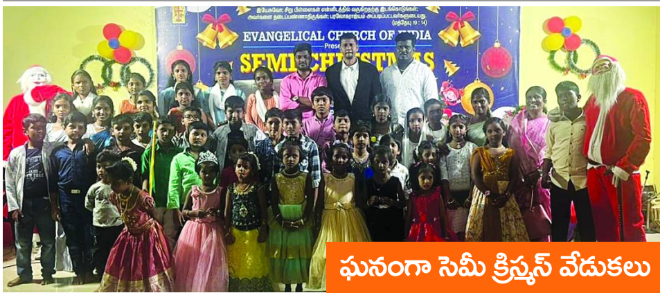
ఘనంగా సెమీ క్రిస్మస్ వేడుకలు

విస్తృత అనుభవం కలిగి ఉండగా, ఆయన నాయకత్వంలో ఆర్బీఐ అనేక కీలక నిర్ణయాలు తీసుకునే అవకాశముంది. ఈ నియామకం ప్రస్తుతం దేశ ఆర్థిక పరిస్థితులపై ప్రభావం చూపనుంది.